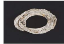
オオツタノハ貝輪(コマ)