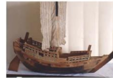
江戸時代のヨイ舟(模型)