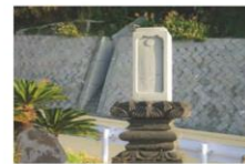
生島新五郎の墓 (伊ヶ谷)